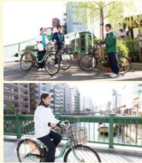
台東区はもちろん、訪問エリアの下町情緒を感じながら、自転車での訪問を行っています。

実際の生活の場へお伺いし、病気やケガによって衰えてしまった身体機能や体力を取り戻したり、維持したりするためのトレーニングはもちろん、日常生活の自立、外出や趣味活動など社会参加を目指すためのリハビリテーションも行います。 ご自宅での生活や、社会参加が思うように進まない原因はさまざまです。その原因を探り、それぞれの状況に応じアプローチを行っていきます。 国家資格を有するリハビリテーションの専門職である理学療法士、作業療法士、言語聴覚士が訪問いたします。