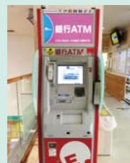
2階売店正面、エレベーター降りてすぐです!

かねてよりご要望の高かったATMを設置いたしました!コンビニなどに置かれているイーネットATMは、ほとんど全ての金融機関のカードが使えます。