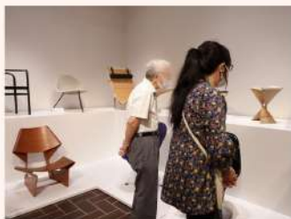
一つひとつの椅子をじっくり鑑賞していきます。