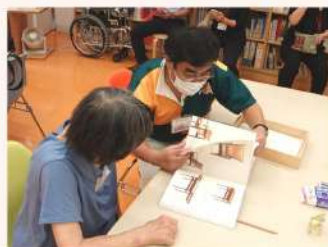
座って体感したり、素敵なデザインを発見したり。楽しい時間を過ごしていただけたようです。