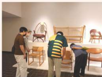
展示されている椅子についての解説にも目を通します。