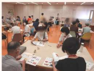
最初に集めたアートスタイルルームに戻って図録を見ながら、振り返りをしました。