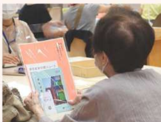
最後に東京都美術館からご案内リーフレットなど一式をいただきました。