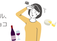
図1 片頭痛の誘発・増悪因子