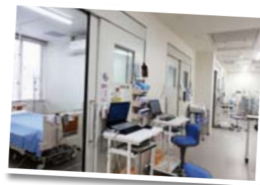
増床した4床の個室。感染症対策のとれた陰圧個室もあります。