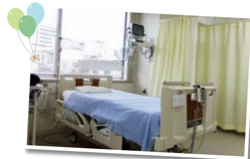
大部屋のようなオープンフロア4床はカーテンで仕切り、迅速な対応を可能にしています。

二次救急医療機関として「断らない 救急医療」を掲げ、これからも地域医療に貢献できるよう努めて参ります。